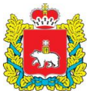
Герб Пермской области, 1995 год